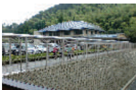
宍原荘/みすず 実地訓練の様子

みすずの訓練内容は、避難先で保護者に引き渡す想定でした。みすずでは保護者の皆様との間でご本人であることを確認させていただき秘密の数字があります。訓練も大事ですが今日は引き渡したまま靴を履き替えてお母さんたちといっしょに帰宅です。後姿を見送りながら万が一の災害時もお迎えの家族と手をつないで帰宅できるよう避難対策に努めなければと改めて心に誓つた一日でした。