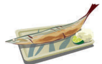
秋の味覚と言えば...