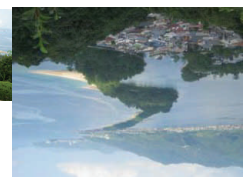
こんな風に見えます